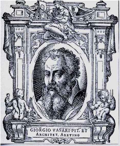
LE VITE DE' PIV ECCELLENTI PITTORI, SCVLTORI ET ARCHITETTORI scritte da Giorgio Vasari Pittore et Architetto aretino